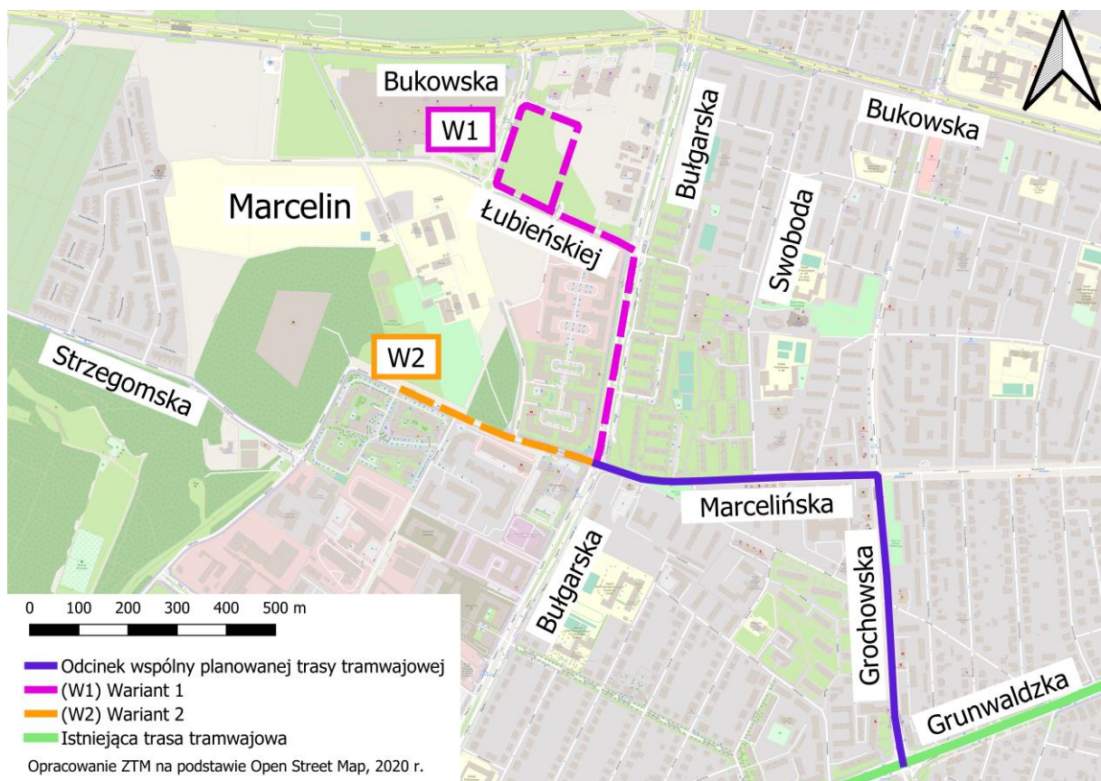
Ryc.: koncepcyjny przebieg trasy tramwajowej na Marcelin Opracowanie: ZTM Poznań

Przebieg trasy tramwajowej w rejon Marcelina został wyznaczony przez obszar ścisłej zabudowy mieszkaniowej i usługowej, wzdłuż granic administracyjnych następujących osiedli: Grunwald Południe, Stary Grunwald, Grunwald Północ i Ławica.